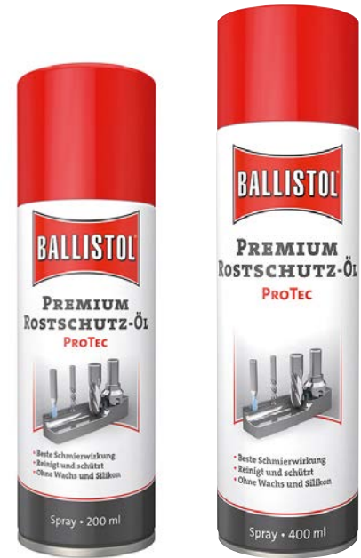
Art.-Nr. 82431 - 200 ml