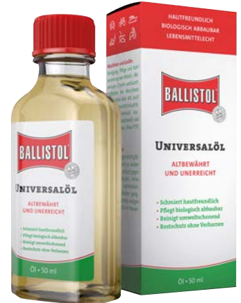
Art.-Nr. 82205 - 50 ml