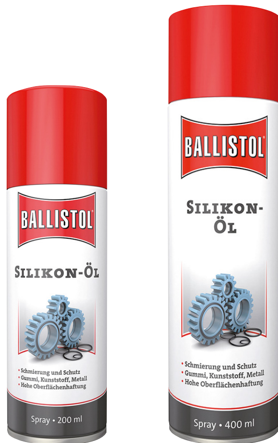
Art.-Nr. 82184 - 200 ml