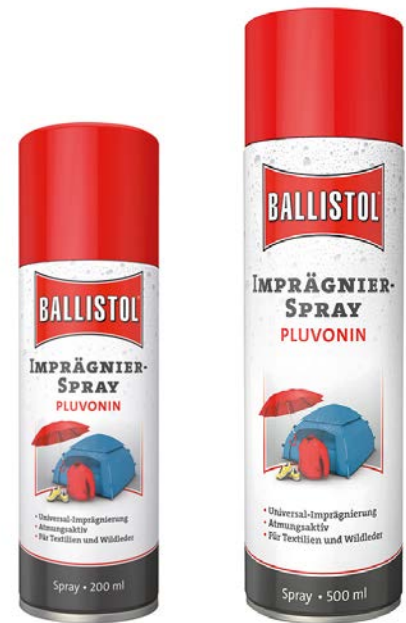
Art.-Nr. 82180 - 200 ml