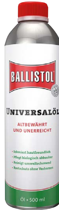
Art.-Nr. 82174 - 500 ml