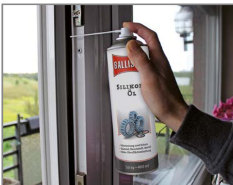
Art.-Nr. 82185 - 400 ml