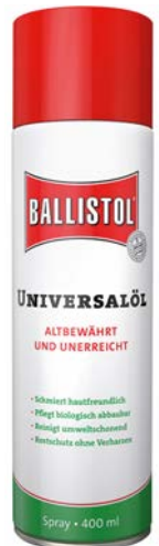
Art.-Nr. 82176 - 400 ml