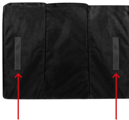
Klettband am Boden zur guten Halt am Kofferraumteich